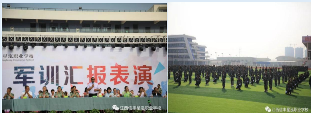
图 1-4 新生军训汇报表演

沙场秋点兵，青春正当时。9月30日，江西信丰星泓职业学校举行“青春正当时 铸就新未来”国防教育军训汇报表演。