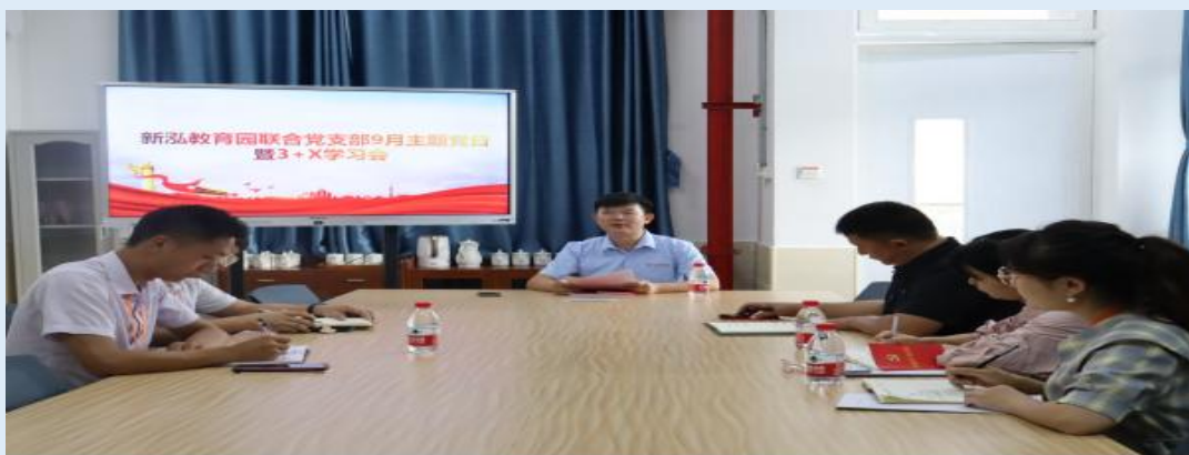
图 1-1 学校党员党课课堂

课堂内容进行讨论，择要辅导，测试学习效果，进行小结等。务实求效，让师生们真正的获得学习和收获。支部还让学生们在社会生活中主动感受党的精神、体会党的建设成就和党的文化。比如让学生们访谈身边的优秀党员、调查所在社区、村组党员数量等等。通过党课让师生对党的认识更进一步提高，对党的热爱更进一步加深，能够更加清晰和明确党的历史、发展、政策路线和党的精神，树立新时代正确的人生观、价值观和思想观，更加坚定对党的社会主义事业的信心和决心。