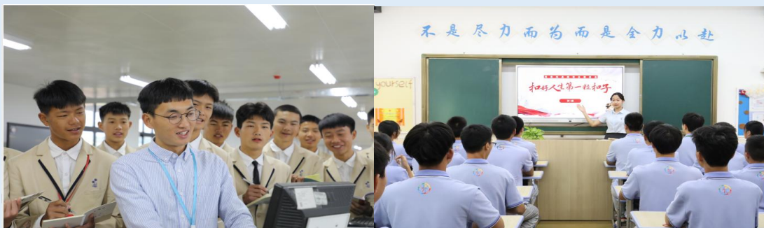
图 2-5 青年教师示范课堂

路漫漫其修远兮，吾将上下而求索。教学改革一直是教师为之奋斗不止、钻研不停的事。此次活动在教学部精心部署下，在教研组长的带领下教师们各施其法，各展其才，呈现出了一堂又一堂既有趣味性又能学习知识，把思想政治教育巧妙融入教学的课堂。异彩纷呈的示范课犹如百花在“星泓教研之园”竞相开放，授课教师全新的教学方法，高超的传授技能，高效的课堂，展示着青年教师素养，体现着新课改的成果。