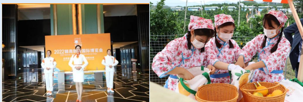
图 4-1 志愿者服务图

周到的服务，热情的身影，那是星泓志愿者的标志。活动期间，他们活跃在主会场、酒店、信丰礼物馆、水果馆、企业品牌馆及各县区展位。他们主动指引过往客人，细心解答嘉宾疑惑，全力帮助每一位需要帮助的人，为赣南脐橙国际博览会增添一片暖心的“橙”意。