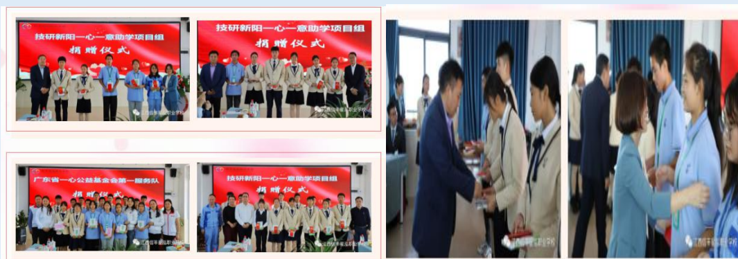
图 4-2 企业家资助贫困学生

2021年10月28日，一心一意公益助学交流会成功举办，共有47个家庭的贫困孩子受到了捐助，共计金额16.8万元。