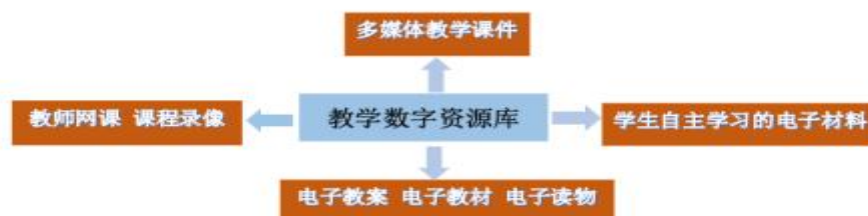
图 2-3 江西信丰星泓职业学校数字资源库建设结构图

学校以创建精品数字资源为核心，广泛采用多媒体辅助教学手段，建立信息共享和自主学习平台上的立体化教学资源库，实现全校师生的网络教学资源的共享与应用。规划 2023 年建立并校内开放，整合相关教学资源，建立电子教案库、实训案例库、教学录像、教学课件、多媒体教学平台、试题库、课程录像等多种媒体形式组成的教学资源库系统。将多媒体技术最大可能地植入专业教学活动之中，为学生提供个性稳定、功能强大的自主学习平台；促进主动式、协作式、研究型、自主型学习，形成开放、高效的新型教学模式。目前， 教学中应用的在线课程总数 36 门。为应对新冠疫情对学校这种特殊的人员密集型单位的冲击，维持正常的教学管理活动，结合智慧校园平台，在疫情期间有效开展疫情管理，实现疫情期间在线教学服务、财务服务、疫情监测、返校学生信息采集、返校途中路经采集、后勤服务、关键位置体温检测及日志分析、大数据分析等。