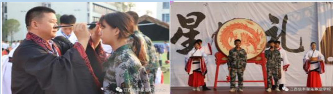
图 1-3 星泓礼部分选图

活动中，2021级新生及老师们，向先贤孔夫子像和陶行知先生像行礼，表达对圣贤的敬意。随后，新生们开始正衣冠，行拱手礼，以示对教师的尊敬，老师们用朱砂在新生们的额头上点红痣，以朱砂寄托美好的愿望，祝福孩子们从此眼明心亮。随后，新生们“开笔破蒙”并击鼓明志，表明自己远大的志向。