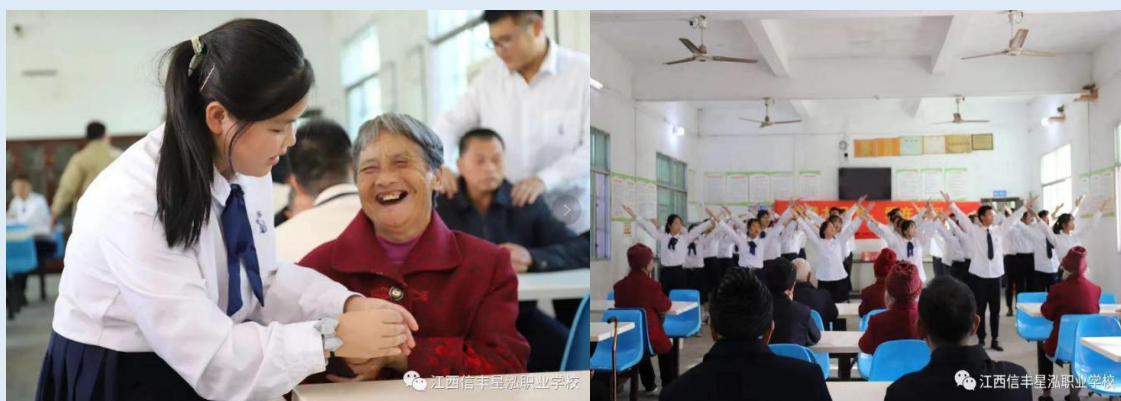
图 4-4 关心敬老院老人图

农历九月九日，是我国传统的重阳佳节。为发扬我国传统孝道和报本思源的美德，每年重阳节，我校部分同学在老师的带领下参加了敬老院慰问活动。