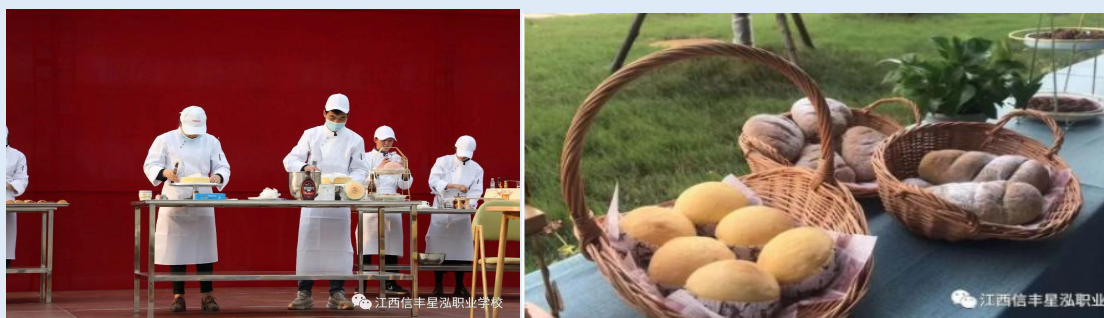
图 2-1 烘焙项目教学学生成果

的教学改革。主要实施方式是老师将一个相对独立的项目交由学生自己处理，信息的收集、方案的设计、项目实施及最终评价，都由学生自己负责，学生通过该项目的进行，了解并掌握整个过程及每一个环节中的基本知识和技术要领，学生学习效果良好，得到师生广泛认可。通过实施“主题+项目”的教学方法改革，学生的实践能力、产品完成能力、分析能力、口头和书面表达能力、面试能力、就业竞争能力及知识掌握的透彻程度明显提高。